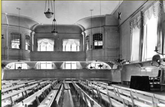
KIRCHENSAAL MIT SCHWESTERNEMPORE VOR 1945

Er liegt uns am Herzen wie kein zweites Gebäude in Herrnhut. Ohne ihn können wir uns das Gemeindeleben nicht vorstellen. Früher nannte man ihn »Gemeinsaal« oder »Betsaal«. Etwa 700 Besucher finden darin Platz. Obwohl er unsere Kirche ist, sollte er nie ein sakraler Raum, stattdessen immer die »gute Stube« der Gemeinde sein.