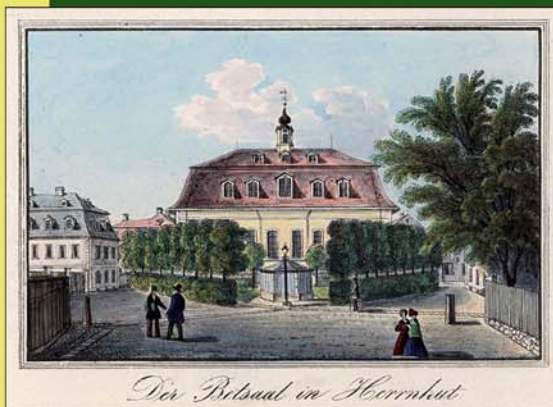
Der Betsaal in Herrnhut